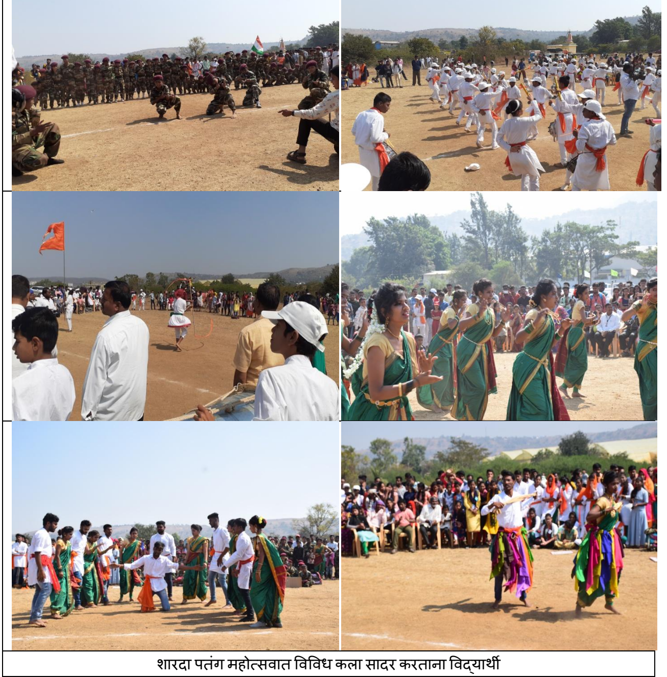
शारदा पतंग महोत्सवात विविध कला सादर करताना विद्यार्थी