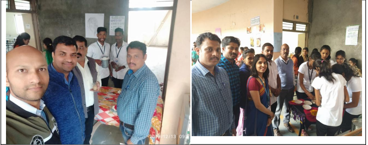
मार्केटिंग फेअर दरम्यान वस्तूचे वितरण करताना विद्यार्थी