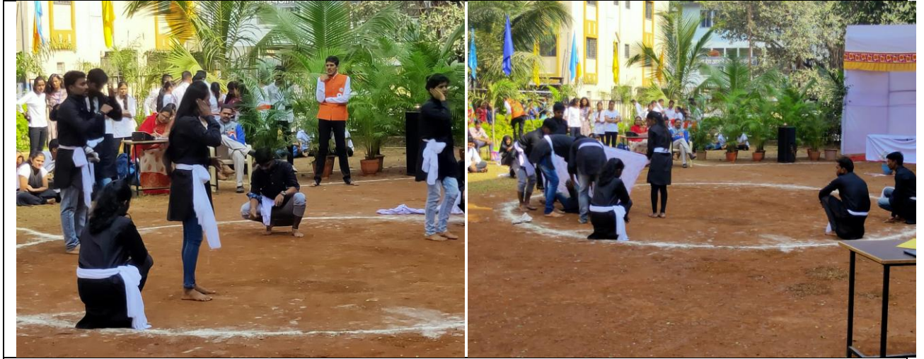
महिला सबलीकरण या विषयावर पथनाट्य सादर करताना विद्यार्थी

रयत शिक्षण संस्थेचे डॉ. बाबासाहेब आंबेडकर महाविद्यालय औंध यांच्या वतीने दिनांक ०३/०१/२०२० रोजी पथनाट्य स्पर्धेचे आयोजन करण्यात आले होते. महाविद्यालयातील सांस्कृतिक विभागाच्या वतीने महिला सबलीकरण या विषयावर पथनाट्य सादर केले.