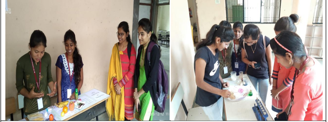
विज्ञान प्रदर्शनादरम्यान प्रोजेक्ट चे सादरीकरण करताना विद्यार्थी