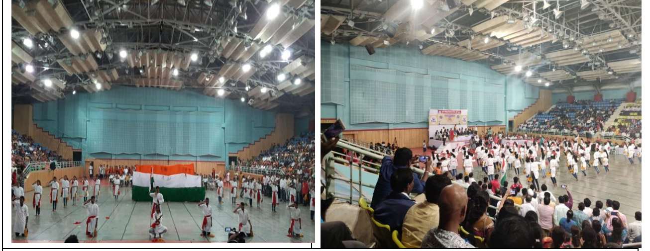
“जय हो” या देशभक्तीपर गीतावरती सामूहिक नृत्य सादर विद्यार्थी