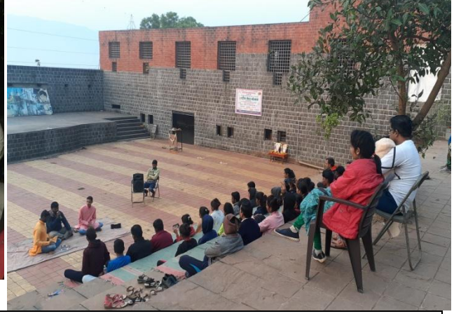
रा. सो. यो. शिबिरामध्ये विविध कला सादर करताना विद्यार्थी